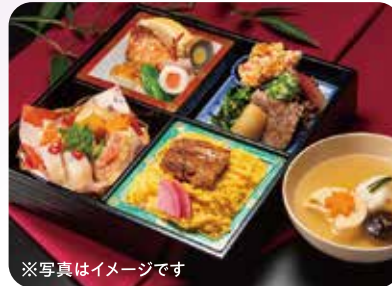
※写真はイメージです