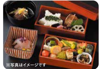
※写真はイメージです